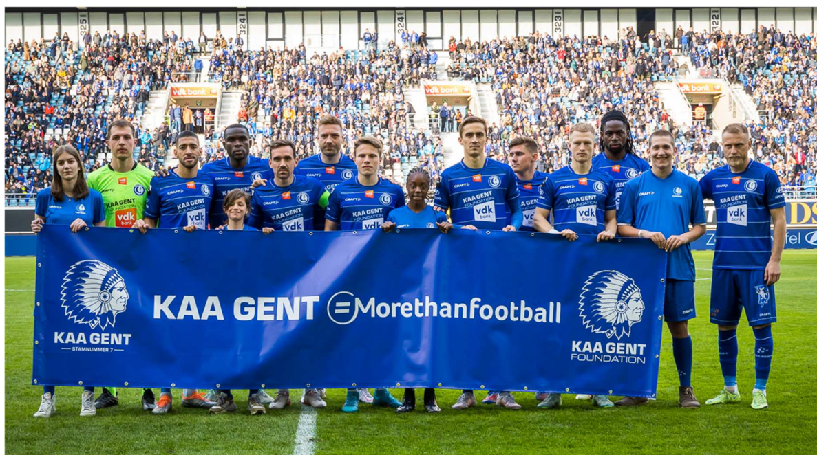
Wedstrijd van de KAA Gent Foundation, 10 april 2022

Totaal 3476,08 uren publieksgerichte activiteiten in de hele werking, waarbij 60174,25 contacturen werden gerealiseerd.